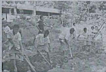
๔ ชุมชน สังคม เกษตรเพื่ออาหารกลางวันโรงเรียนสมเด็จพระศรีนครินทร์