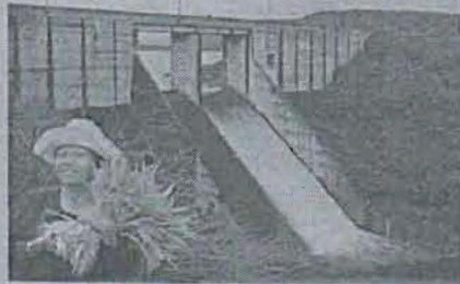
๓ เกษตรกรรม กรมบริหารจัดการน้ำในจังหวัดนครราชสีมา

■ บริการเพื่อประชาชน การขยายเตียงประชามติทางรัฐธรรมูญฯ อ่านต่อหน้า ๑๖